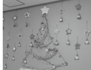
☆園児がつくったクリスマス飾り

※「すくすくおおだっ子」は市内の子育てサロンや子育て支援に関わる団体・組織でつくるネットワークです(事務局:大田市社会福祉協議会)。地域のみんなで子育てを応援・サポートできる環境づくりをめざしています!